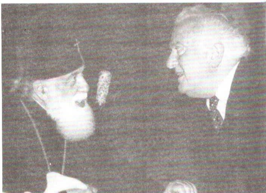
اسقف اعظم گرجستان ایلیای دوم و فرزند خوانده وی ادوارد-گیورگی شواردنادزه.