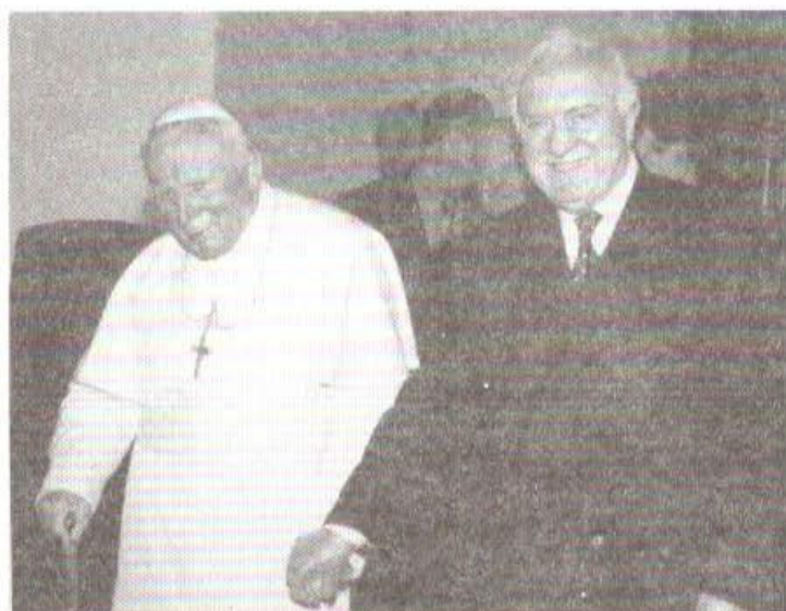
پاپ روم ایوان پاول دوم در گرجستان.