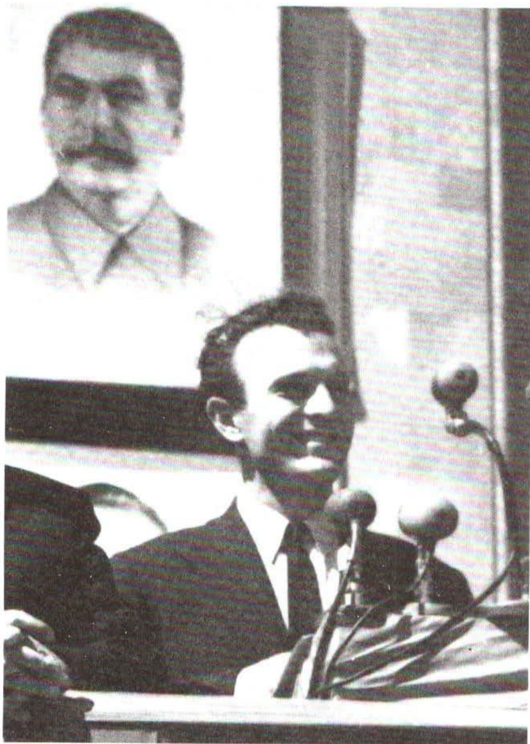
محض اطلاع بدانید که بدون حضور گرجیان تصمیمات سیاسی بزرگ اتخاذ نمی‌شود.