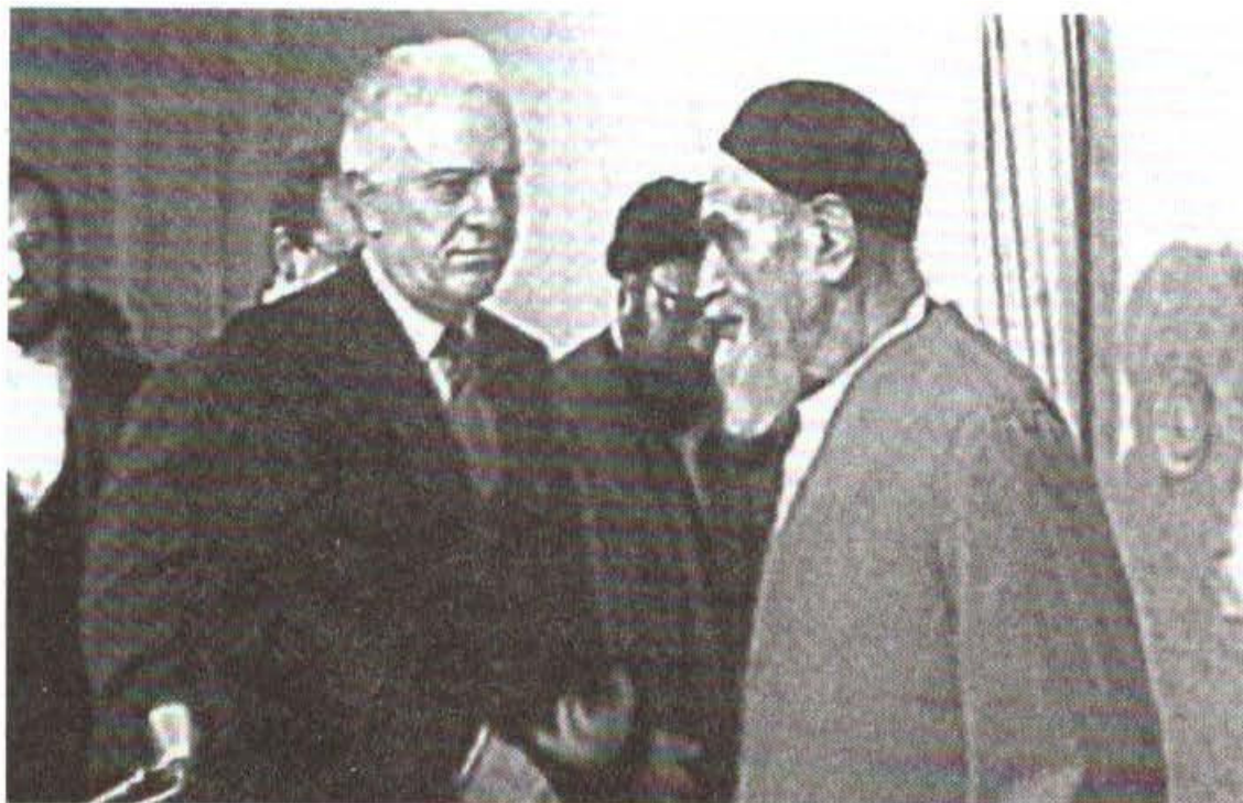
ملاقات با آیت‌الله (امام) خمینی رهبر انقلاب اسلامی ایران