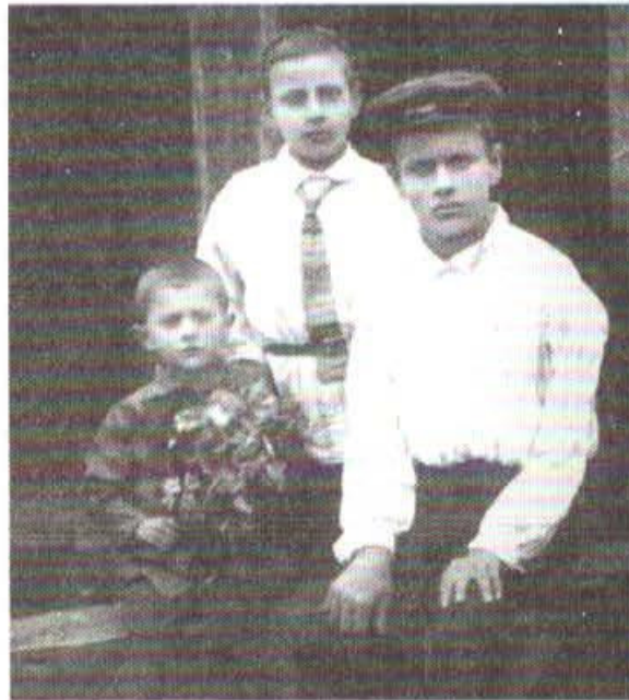
با برادران بزرگترم.