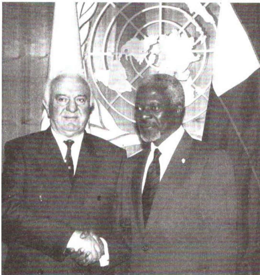
رئیس جمهور گرجستان ادوارد شواردنادزه و دبیرکل سازمان ملل کوفی عنان.