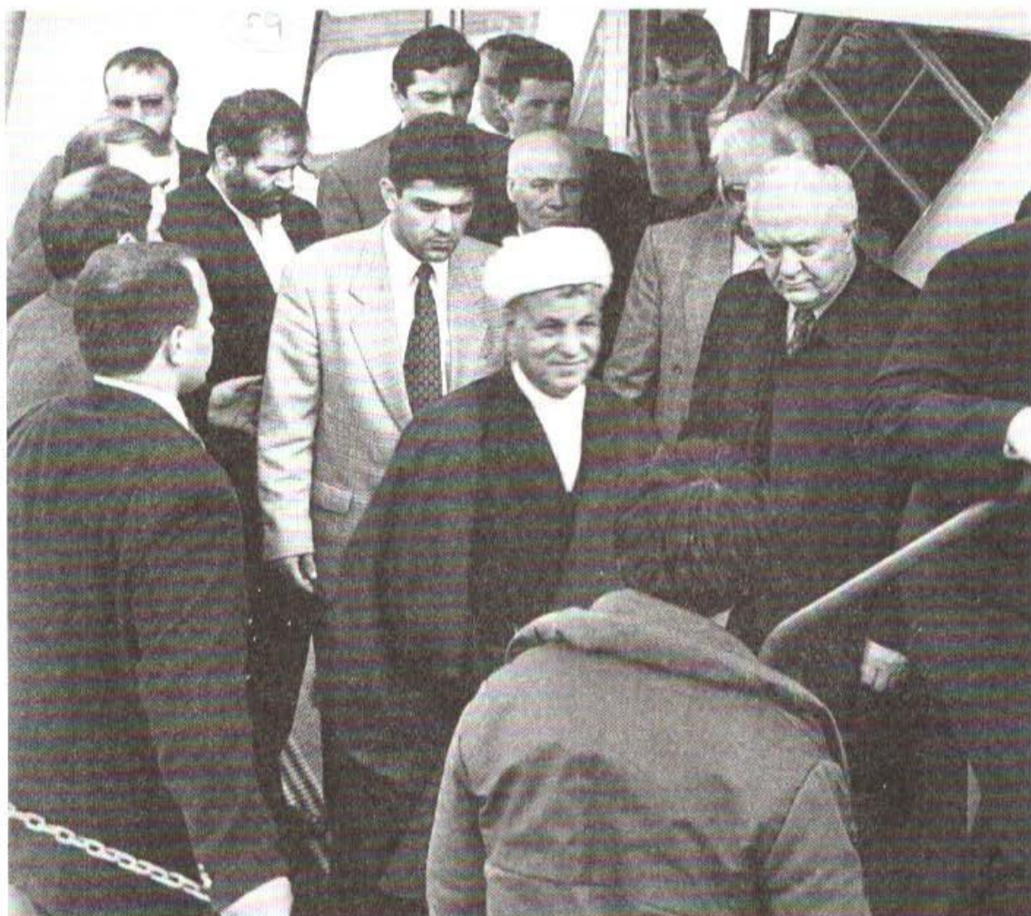
سفر جناب آقای هاشمی رفسنجانی رئیس جمهور ایران به شهر باتومی - سال ۱۹۹۵