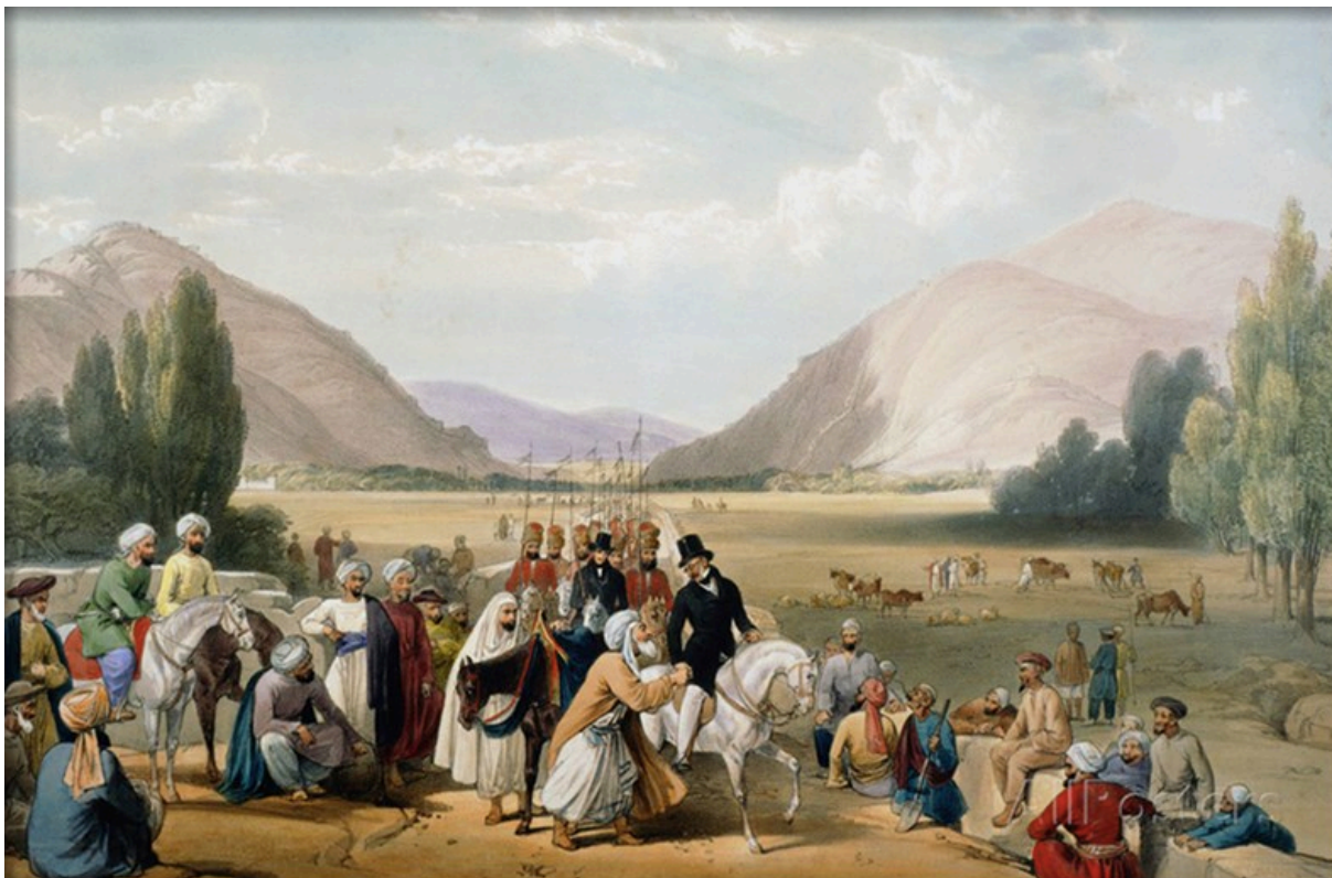
تسلیمی دوست محمد به مکناتن در کابل

که هرات را از محاصره خلاص نموده و دوست محمد را با شاه شجاع تعویض کنند. لذا در نومبر ۱۸۳۸ ارتش نیرومندی از راه کندهار بطرف کابل می فرستند که در اواخر مارچ ۱۸۳۹ اندوس را عبور نموده، در اپریل وارد کندهار، در جولای وارد غزنی و در اگست وارد کابل شده، دوست محمد به بخارا فرار نموده و شجاع را بر تخت کابل می نشانند. برنس باز هم به حیث نماینده سیاسی در دربار شاه شجاع در کابل باقی میماند تا اینکه در نومبر ۱۸۴۱ در کابل کشته می شود (دوست محمد پس از برگشت از بخارا و تسلیم شدن به انگلیس ها در نومبر ۱۸۴۰ به هند تبعید شده و پس از قتل شاه شجاع در اپریل ۱۸۴۲، بر تخت کابل در ۱۸۴۳ نشانیده می شود. به اساس بعضی روایات، او بلخ را در ۱۸۵۰، کندهار را در ۱۸۵۴ و هرات را در می ۱۸۶۳ قسماً ضمیمه کابل ساخته و در جون ۱۸۶۳ در هرات فوت می کند. گفته می شود، او همچنانکه ۲۰ برادر داشت، به هنگام مرگ خود ۲۵ زن و ۵۲ فرزند به میراث گذاشت).