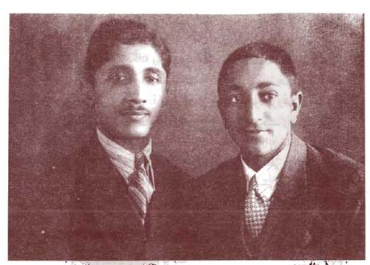
اسداف علم و امیرحسین خزیمه علی می سوانی مختاه نق تابای، امید همشوو افشا