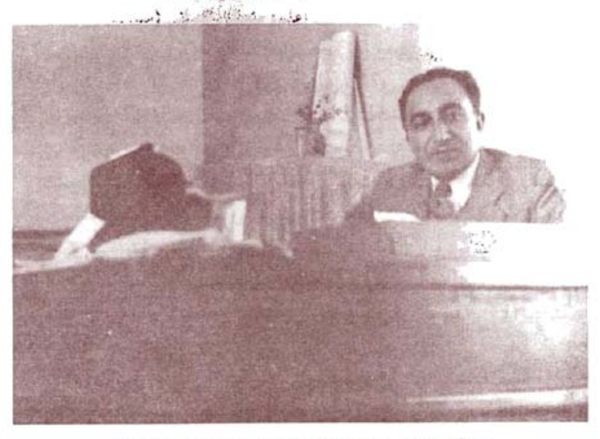
اسدالهٔ علم هنگام ریاست دانشگاه پهلوی در دفتر کار خود (۲۷۴۹_۱_