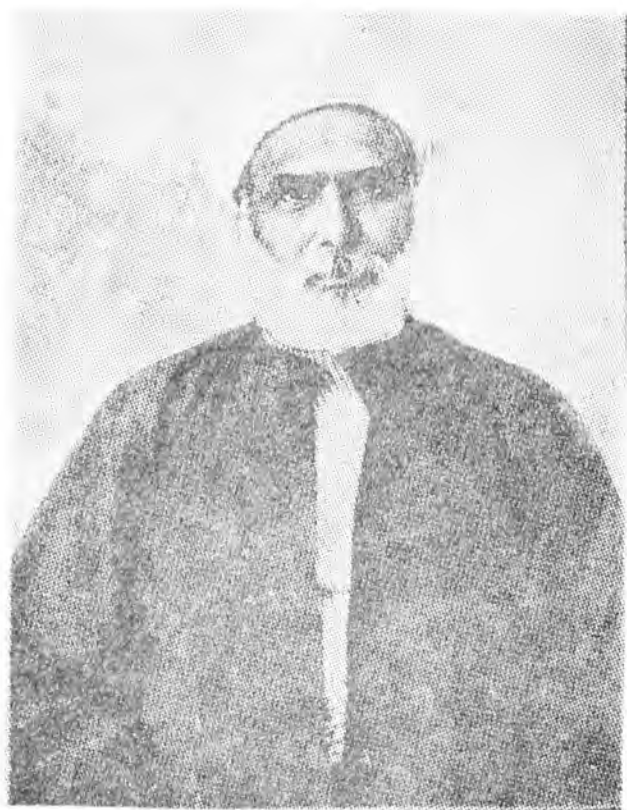
شيخ محمد عبده دالعروة الوثقى دجريدى مسوول مدير .