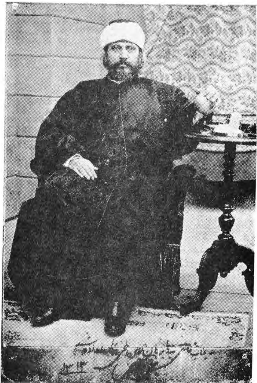
دشوق نابغه افغانی سید جمال الدین